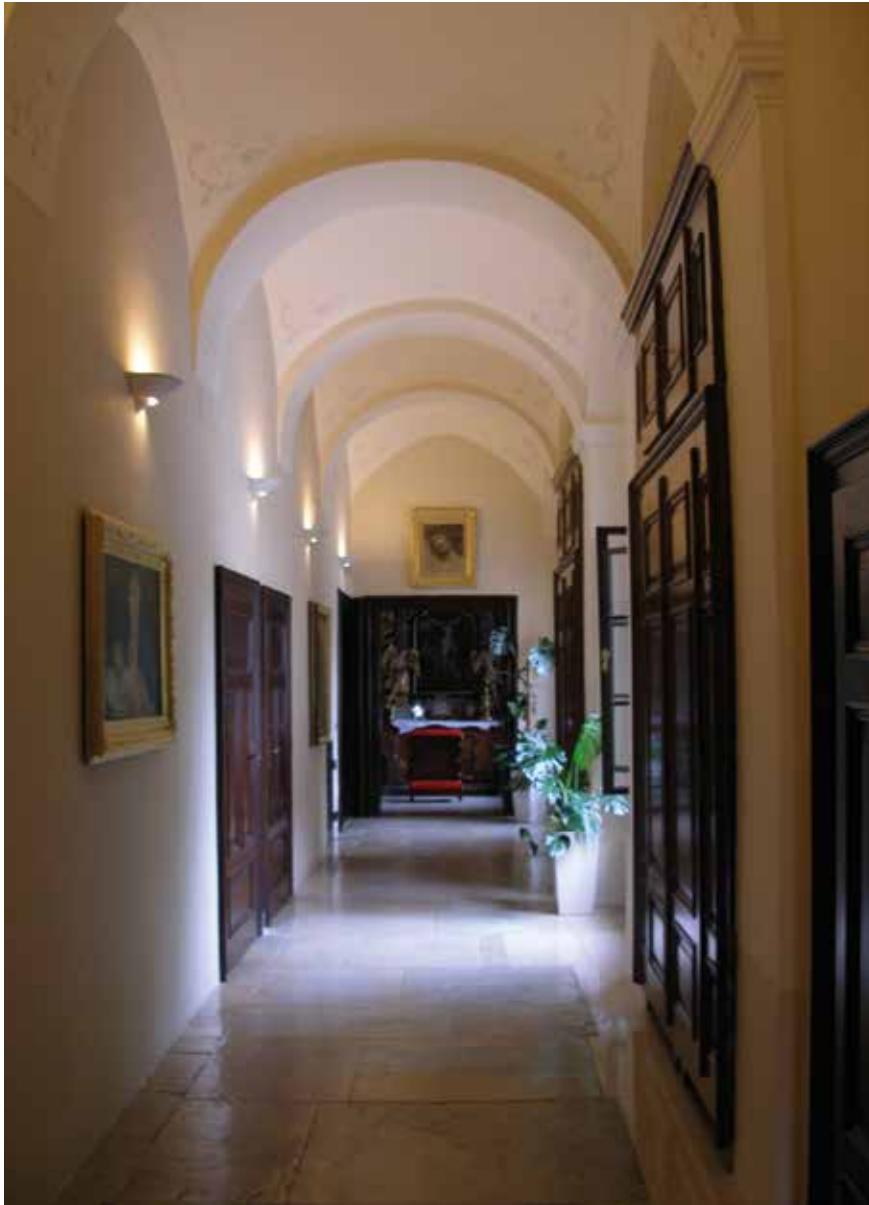
Hodnik na katu s kapelom, 2010.