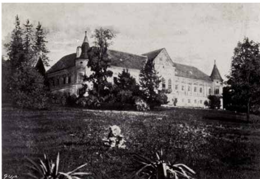
Perivoj ispred južnog pročelja dvorca, razglednica, početak 20. stoljeća

Prvi vlasnik imanja Lužnice bila je plemićka obitelj Čikulina, podrijetlom iz Italije. U Hrvatskoj se Čikulini javljaju u 16. stoljeću. Ženidbenim vezama i dobrim gospodarenjem stekli su brojna imanja. Među najvažnijim predstavnicima obitelji bio je Julije Čikulina (1580.-1634.), upravitelj vinodolskih posjeda Nikole Zrinskog i vješt trgovac. Zrinski ga je optužio zbog zlouporabe i krađe, oduzevši mu neka imanja. Tek nakon smaknuća Petra Zrinskog sin Julija Čikulina uspio je sudskim putem vratiti imanja 1685. godine, a uime odštete dobio je Medvedgrad i Šestine s inventarom te kuću s inventarom Petra Zrinskog na Markovu trgu u Zagrebu. Nakon što je napustio mjesto upravitelja po-