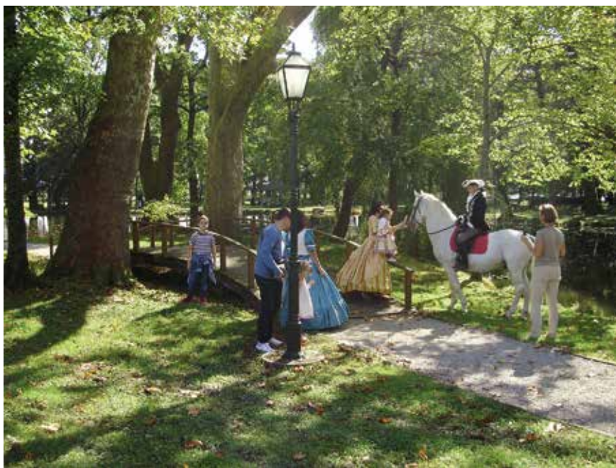
Nastup udruge Lipicanska barokna raskoš na Danima otvorenih vrata Lužnice