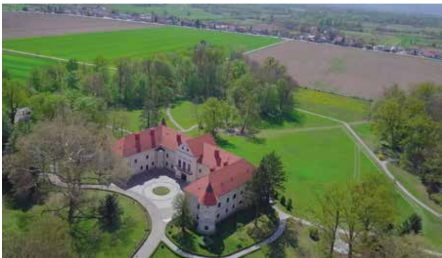
Lužnica iz zraka