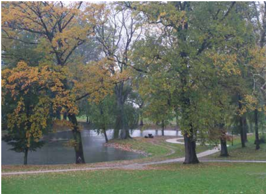
Jezero u perivoju, 2010., zbirka Šćitaroci