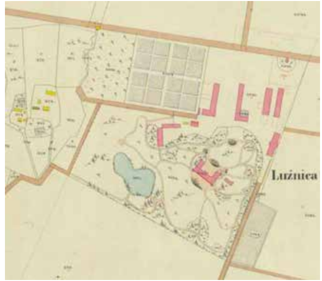
Katastarska karta, dvorski sklop, 1862.

Počeci promišljanja o novom i drukčijem korištenju dvorca Lužnica poklopili su se s početkom europskog projekta „ Villas, stately homes and castles - compatible use, valorisation and creativ management “, u kojem su autori ovog teksta bili uključeni kao voditelji hrvatskog dijela projekta. Bili su to počeci europskih projekata koji su tada bili malobrojni, a danas su nasreću brojni i raznoliki. Nakon nekoliko godina časne sestre su pokazale kreativnost u upravljanju i osmišljavanju programa suvremenog korištenja dvorca. Svoju ideju iznijele su na međunarodnom znanstvenom skupu Villas na Arhitektonskom fakultetu Sveučilišta u Zagrebu ispred 300 sudionika iz Hrvatske i desetak europskih zemalja. Znale su i htjele su slušati savjete stručnjaka; bile su znatizeljne i tražile primjere dobre europske prenamjene dvoraca i njihovog suvremenog korištenja; bile su spremne učiti (kao i danas) i svladavati nepoznato. Takav pristup doveo je do prepoznatljivog rezultata i sustavne obnove i revitalizacije dvorca, na tragu promotivne sintagme projekta Villas o naslijeđu dvorca kao pokretača gospodarskog razvoja. Dva zbornika radova s međunarodnih skupova Villas u Hrvatskoj (2005. i 2006.) dostupni su na internetu. Danas je dvorac Lužnica Duhovno-obrazovni centar „Marijin dvor“ s raznolikim duhovnim, obrazovnim, turističkim i kulturnim programima. Lužnica se nalazi 20 kilometara zapadno