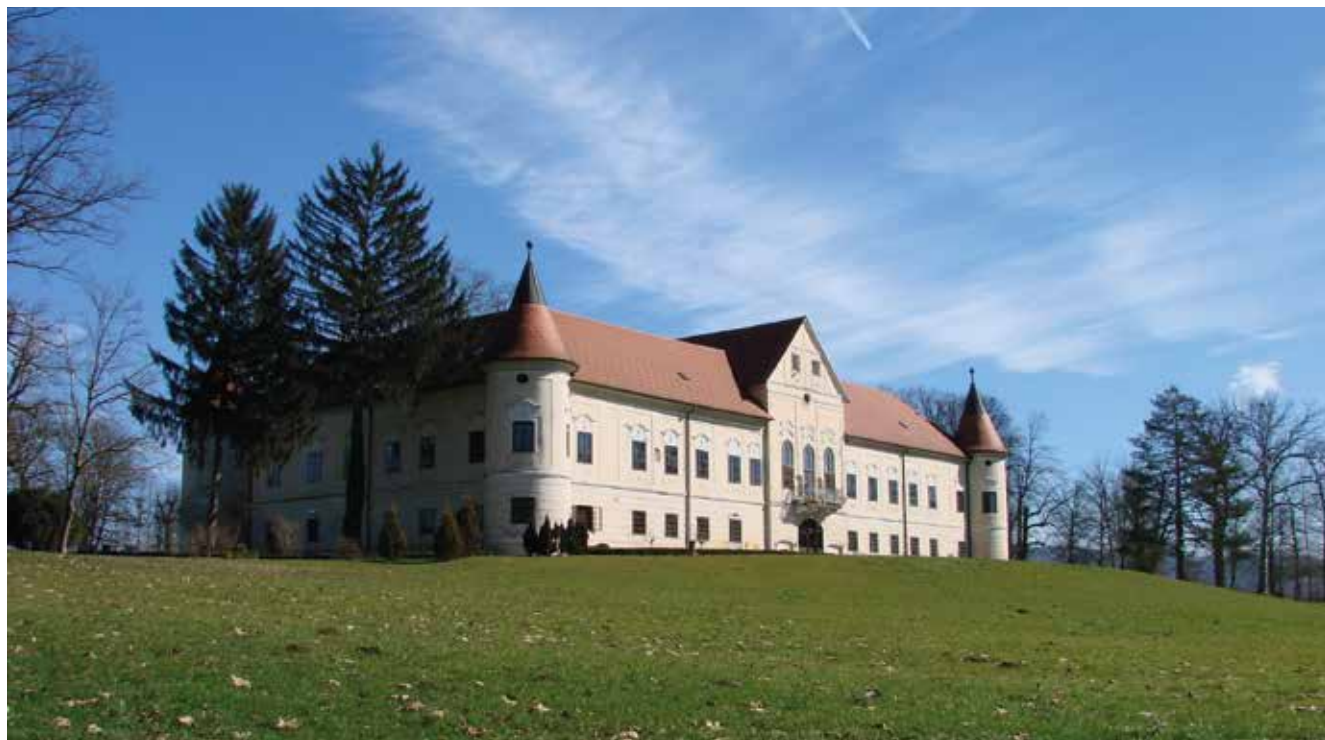
Južno pročelje dvorca, autorica Mia Mikula, 2015.

Napisali: akademik Mladen Obad Šćitaroci i prof. dr. sc. Bojana Bojanić Obad Šćitaroci