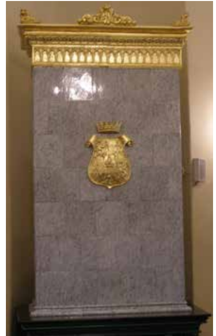
Siva kaljeva peć, 2010., zbirka Šćitaroci

Od izvornog inventara u dvorcu je sačuvano nekoliko kaljevih peći iz druge polovice 19. stoljeća, kamena balustrada na stubištu i četiri kasnobarokna ugrađena ormara