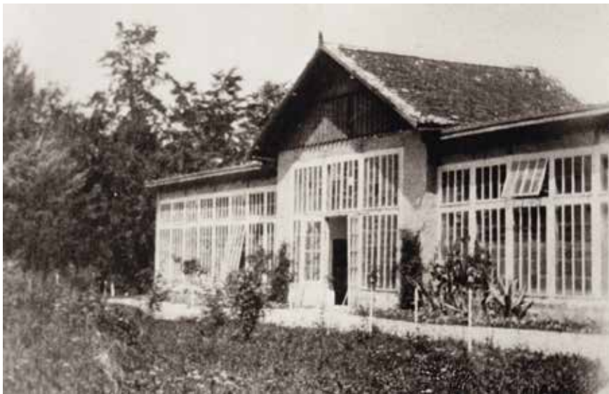
Staklenik u perivoju, 1920-te, izvor: Vuk Steeb, zbirka Šćitaroci