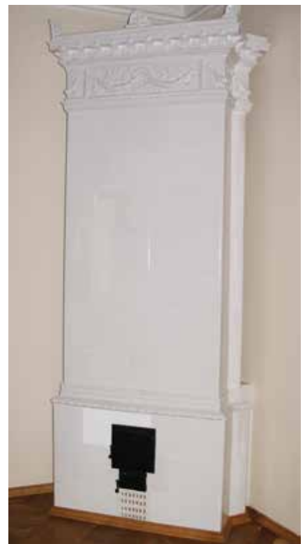
Bijela kaljeva peć, 2010., zbirka Šćitaroci