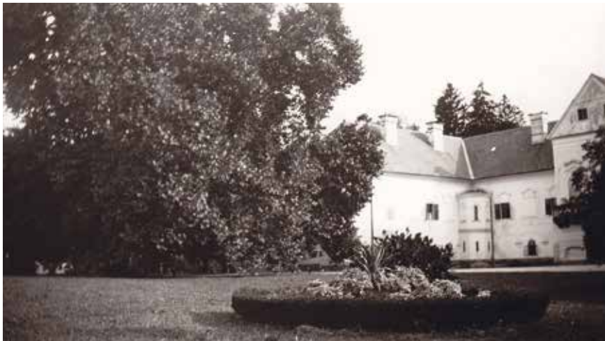
Perivoj ispred sjevernog pročelja dvorca, 1920-te, izvor: Vuk Steeb, zbirka Šćitaroci