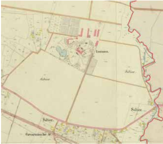
Katastarska karta lužničkog posjeda, 1862.