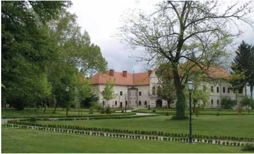
Obnovljeni perivoj sjeverno od dvorca, 2010., zbirka Šćitaroci