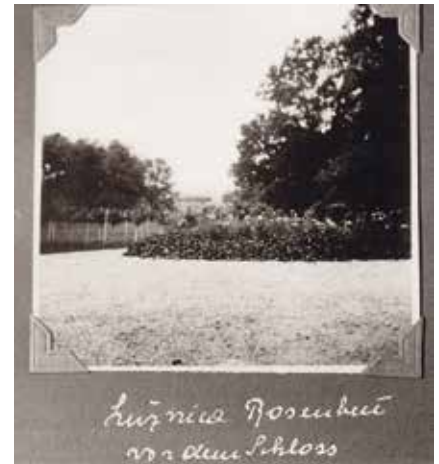
Ružičnjak u perivoju, 1920-te, izvor: Vuk Steeb, zbirka Šćitaroci