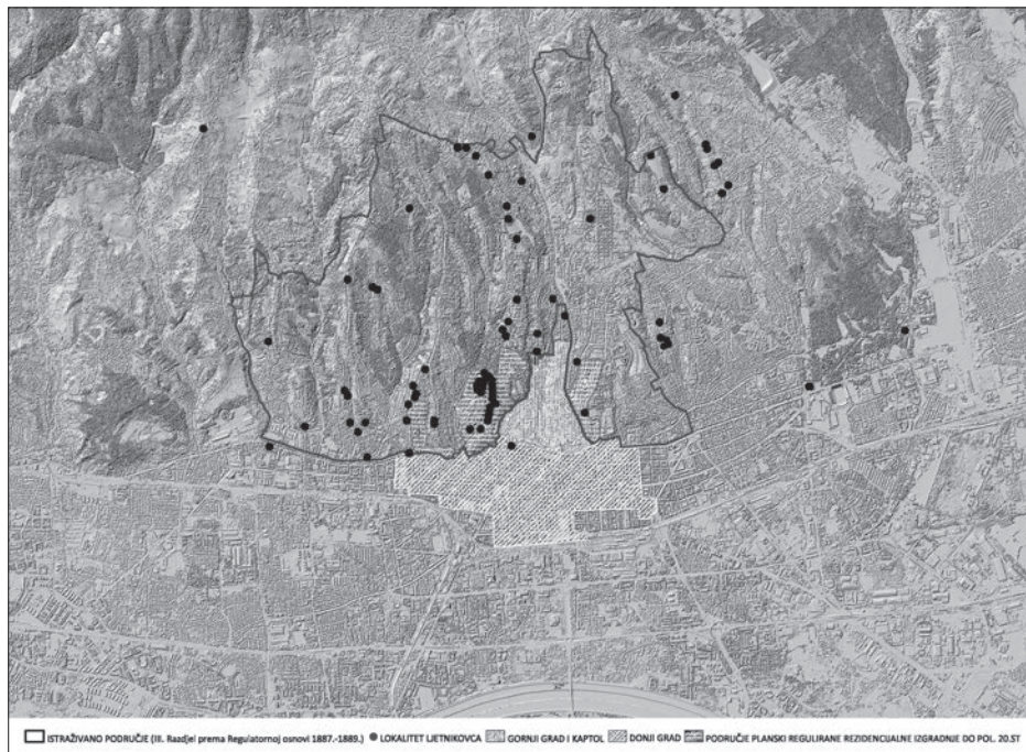
SL. 2. ISTRAŽIVANO LJETNIKOVACKO PODRUČJE ZAGREBA FIG. 2. THE RESEARCHED VILLA AREA OF ZAGREB

lova počinje novo razdoblje života i razvoja grada. Izradom prve karte grada (tzv. specijalka), zatim prve detaljne katastarske izmjere (1857.-1862.), te donošenjem građevnog reda, stvaraju se preduvjeti za teritorijalno proširenje grada, a time i za povećanje broja stanovnika, što bi omogućilo i povećanje radništva u svrhu gospodarskog/industrijskog razvoja. Povezivanje željeznicom i održavanje prve dalmatinsko-hrvatsko-slavonske izložbe 1864. na tragu su promjena koje će modernizirati grad. Godine 1880. Zagreb je pogodio snažan potres koji je razlogom obnove, ali i zamaha promisljene izgradnje grada. U razdoblju koje slijedi, sve do 1900. godine, donose se propisi za izgradnju zgrada na Josipovcu, gradi se cesta na Josipovcu, otvara perivoj na Tuškancu i u to doba bilježimo najintenzivniju gradnju ljetnikovaca. 9 Iste godine administrativna se površina grada gotovo udvostručuje 10 pa tada Zagreb zauzima površinu od 64,38 km 2 . Zbog sve intenzivnije gradnje na brežuljcima, koju je omogućilo donošenje propisa, donosi se čitav niz regulacija ulica na njima. 11 Druga katastarska izmjera dovršena je 1913., prije početka Prvoga svjetskog rata. Do donošenja nove Regulatorne osnove grada 1937. godine gradnja ljetnikovaca jenjava.