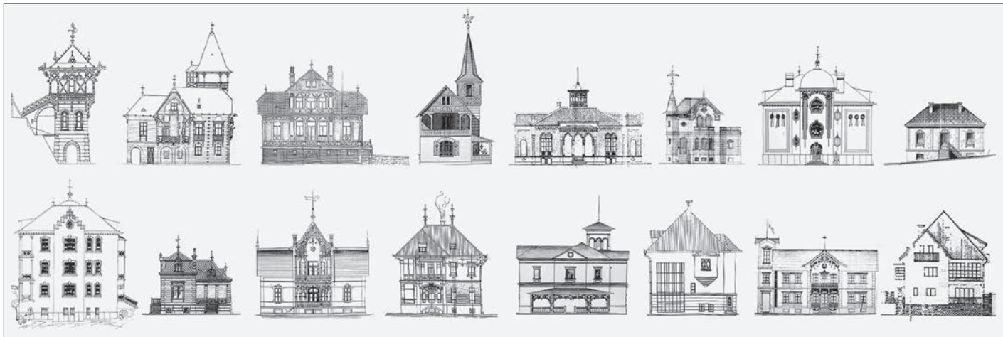
SL. 5. PROČELJA ZAGREBAČKIH LJETNIKOVACA FIG. 5. ZAGREB VILLAS, FACADES