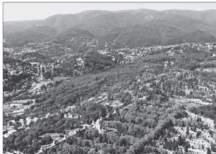
FIG. 4. HILLY LANDSCAPE OF ZAGREB, LJUDEVIT GAJ VILLA AT THE SITE OF THE PRESENT MORTUARY, MIROGOJ (FOREGROUND); VILLA OKRUGLJAK, 2008 (BACKGROUND)

izgrađeno je sedam ljetnikovaca. 27 Nakon administrativnog ujedinjenja grada i stupanja na snagu Građevnog reda dolazi do porasta izgradnje ljetnikovaca pa je u razdoblju od 1857. do 1887. zabilježeno 20 izgrađenih ljetnikovaca, većinom na zapadnom dijelu grada. 28 Za izgradnju zgrada na Josipovcu donešene su polaksice pa su tako od 1888. do 1900. godine izgrađena 44 ljetnikovca. Najviše se gradi u Ulici Gorana Kovačića i Nazorovoj ulici (nekadašnjem Josipovcu) te Tuškancu s Gornjim Prekrižjem. Čak 27 od 33 ljetnikovca na tome predjelu građeno je u to doba. Istodobno se grade tri ljetnikovca na bukovačkom području, a u zapadnom dijelu grada gradi se pojedinačno u ilici, na Svetom Duhu, Vrhovcu i Pantovčaku. 29 Početkom 20. stoljeća grad se postupno širi na bliža okolna područja, a način izgradnje na ljetnikovačkom području postupno prelazi u oblik koji danas nazivamo vilom. Zamjećujemo osjetan pad broja izgrađenih ljetnikovaca. Od 1901. do 1936. izgrađeno je 19 ljetnikovaca. 30 Iako je Generalni regulacijski plan za grad Zagreb iz 1937. godine predviđao izgradnju ljetnikovaca, zabilježena su samo dva primjera. 31