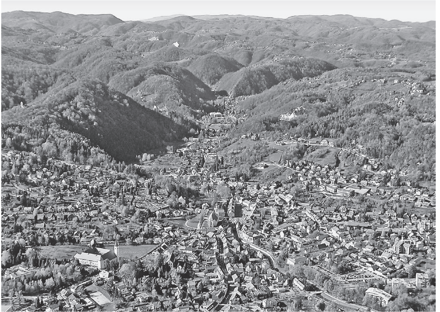
SL. 1. PANORAMA SAMOBORA IZ ZRAKA FIG. 1. AERIAL PANORAMIC VIEW OF SAMOBOR