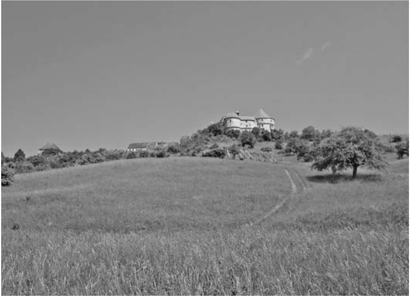
SL. 1. KRAJOLIK VELIKOG TABORA, POGLED S JUGA PREMA DVORCU-BURGU FIG. 1 VELIKI TABOR, VIEW FROM THE SOUTH