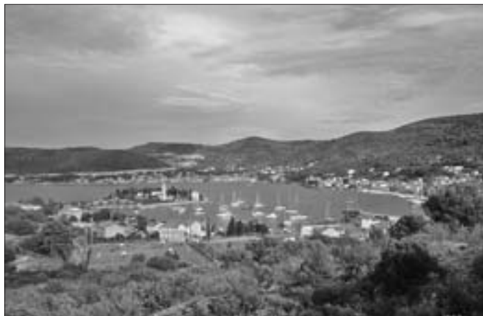
SL. 3. KRAJOLIK GRADA VISA FIG. 3 TOWN VIS