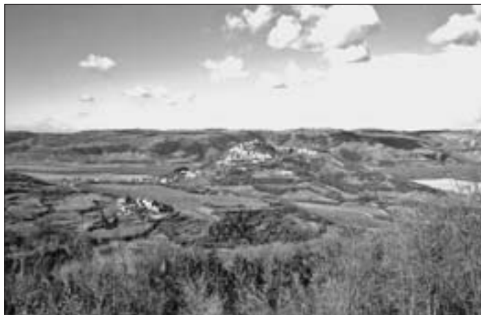
SL. 7. KRAJOLIK SREDIŠNJE ISTRE, MOTOVUN FIG. 7 CENTRAL ISTRIA, MOTOVUN