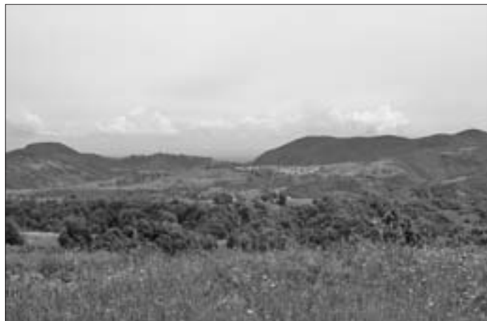
SL. 4. KRAJOLIK PARKA PRIRODE ŽUMBERAK-SAMOBORSKO GORJE FIG. 4 NATURE PARK ŽUMBERAK-SAMOBOR HILLS

Svakomu od kriterija pridodaje se vrijednosna skala od jedan do pet (5 – vrlo visoka vrijednost, 4 – visoka vrijednost, 3 – prosječna vrijednost, 2 – mala vrijednost, 1 – zanemari-va vrijednost). 26